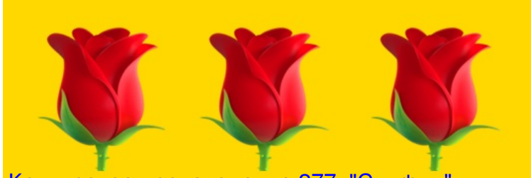
Конкурсное произведение 277 "Скифия"